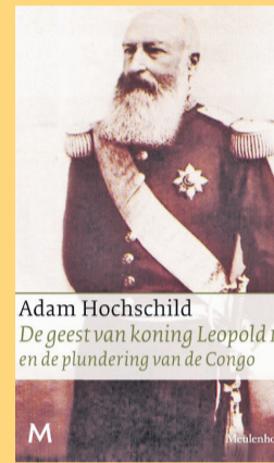
Adam Hochschild De geest van koning Leopold II en de plundering van de Congo